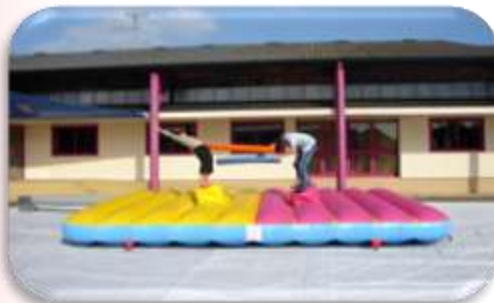
Joutes 5x4 m Tout âge 180 € HT/216 € TTC – livré*