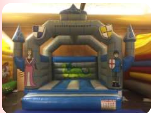
Castle – 5x4x5m Enfants 3 à 10 ans 290 € HT/348 € TTC – livré*