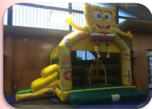
Bob avec toboggan – 5x6x5 m Enfants 4 à 12 ans 310 € HT/372 € TTC – livré*