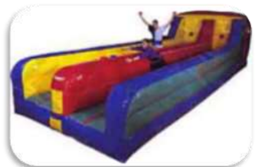
Tir à l'élastique 10 m De 10 à 70 ans 240 € HT/288 € TTC – livré*