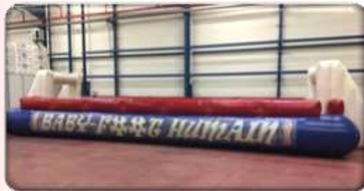
Baby foot humain ou terrain foot 10m x 6m - De 12 à 70 ans 420 € HT/505 € TTC – livré*