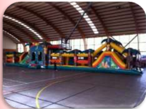
Parcours palmier 14 m Enfants 5 à 15 ans 470 € HT/564 € TTC – livré*