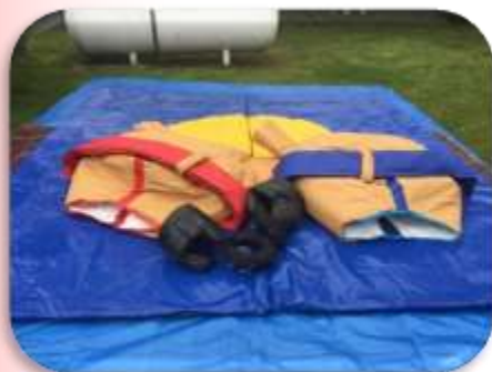
Sumo adultes ou adolescents - Diam : 3m De 12 à 70 ans 180 € HT/216 € TTC – livré*