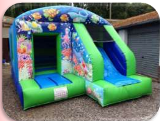
Aqualand toboggan – 5x4x3.5 m Enfants 3 à 8 ans – 8 enfants max. 250 € HT/325 € TTC – livré*