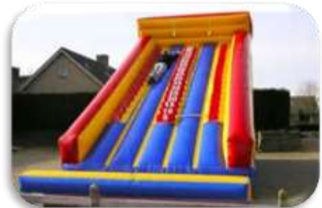
Mur des costauds – De 15 à 60 ans 550€ HT/660 € TTC – livré*