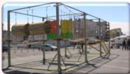
Accrobranche De 6 à 12 ans A partir de 2400€ HT/ 2880€ TTC