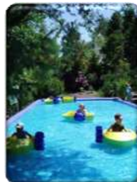
Piscine + pédalo