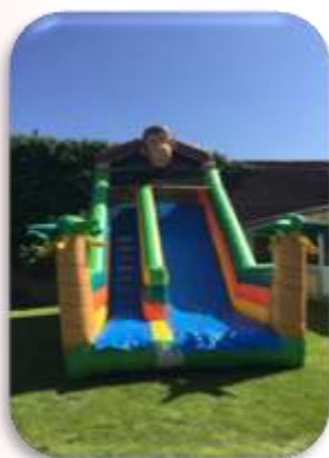
Parcours Toboggan Singe 8x4x4.5m Enfants 4 à 13 ans 400€ HT/480 € TTC – livré*