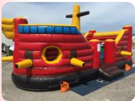
L'abordage – 6x5 m Enfants 3 à 8 ans 190€ HT/228€ TTC – livré*