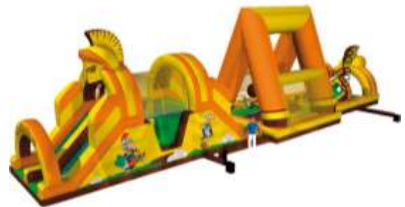
Parcours Gladiateur 24 m Enfants 5 à 14 ans 720€ HT/ 864€ TTC – livré*