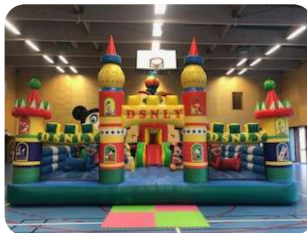
Palais de Mickey – 6x8 m Enfants 3 à 8 ans 480€ HT/576€ TTC – livré*