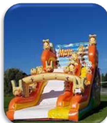
Parcours Toboggan Maya 8x4x4.5m Enfants 4 à 13 ans 400€ HT/480 € TTC – livré*