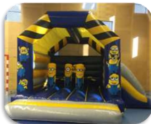
Les Minions – 3x4x4 m Enfants 4 à 10 ans 310 € HT/372 € TTC – livré*