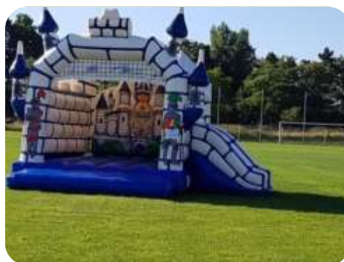
Château fort – 5x4x5m Enfants 3 à 10 ans 310 € HT/372 € TTC – livré*