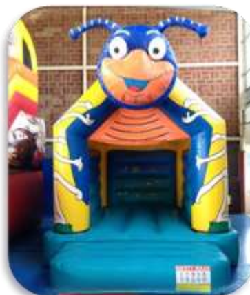
Fourmiz – 5x4x4 m Enfants 3 à 10 ans – 8 enfants max. 220 € HT/265 € TTC – livré*