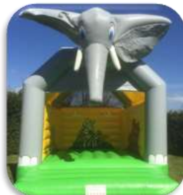
Eléphant – 5x5x5 m Enfants 4 à 10 ans 220 € HT/265 € TTC – livré*