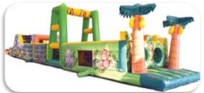
Parcours jungle 14 m ou 17m Enfants 5 à 14 ans 470 € HT/564 € TTC – livré*