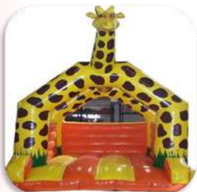
Girafe – 5x4x5.5 m Enfants 4 à 10 ans – 10 enfants max. 220 € HT/265 € TTC – livré*