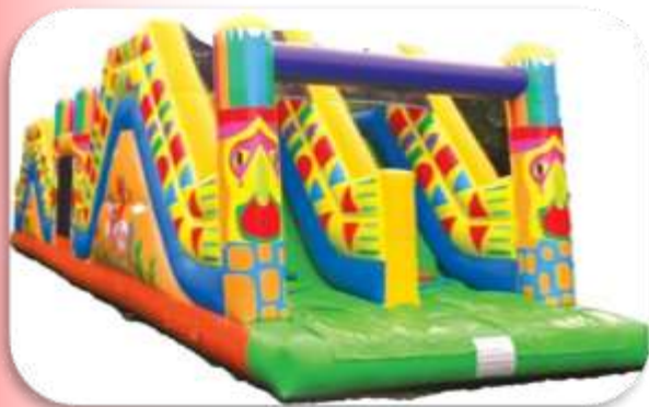
Parcours India 16 m Enfants 5 à 14 ans 480 € HT/576 € TTC – livré*