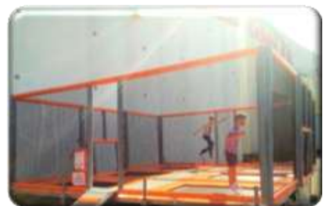
Trampolines Tout âge 620€ HT/ 744 € TTC – livré*